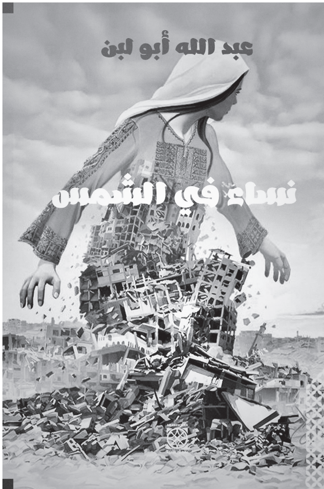
Fig. 2. Portada de la novela Mujeres al sol , de Abdallah Abulaban.

cultural y mundano de primer orden. Insistiendo Said en que la voz del relato, impulsada por la voluntad del escritor de contar su historia —aunque sea ésta de pérdida, desposesión y desilusión radicales—, constituye un acto de resistencia y una actualización moral de la voz humana de alcance primordial.