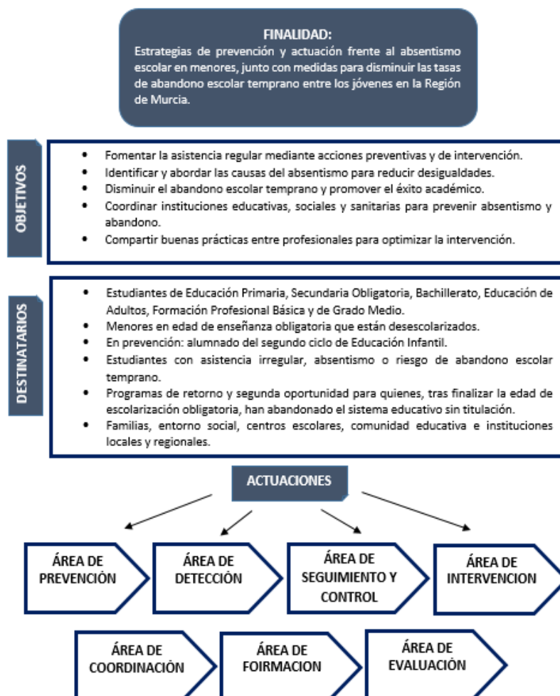
Figura 3. Finalidad, objetivos, destinatarios y áreas de actuación del III Plan Regional para la prevención e intervención en Absentismo Escolar y reducción del Abandono Educativo Temprano en la Comunidad Autónoma de la Región de Murcia (2024-2028) y elaboración propia.

De manera específica, y en relación con las áreas de trabajo descritas en la Figura 6 del III Plan, destacan las siguientes acciones: Tabla 9 (en pág. sig.).