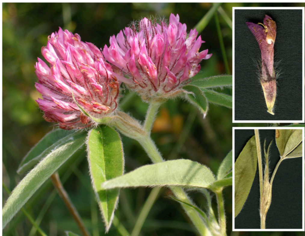
Figura 1. Trifolium alpestre en época de floración, y detalles del cáliz y estípulas.

en duda por Muñoz Rodríguez & al. (2000) tras revisar el género para Flora ibérica, lo que ya apuntaron de Bolòs & Vigo (1984) para la Flora de los Países Catalanes. No obstante, la planta se conoce del sector central de los Pirineos franceses (datos no publ. basados en el Atlas de la Flora de los Pirineos, http://www.atlasflorapyrenaea.org/ ; Saule, 2002). Estas poblaciones francesas fueron ya referidas por Benthams (1826), citas a su vez recogidas por Tubani (1897) en su flora de los Pirineos.