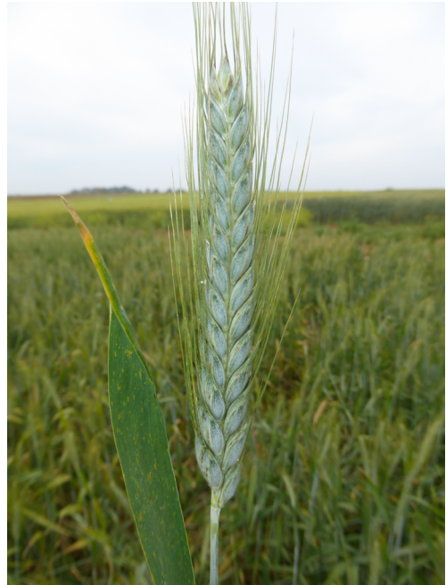
Figura 2. × Tritordeum martinii . España, Córdoba, La Carlota. Detalle de una espiga.

Descripción. Hierba de (45)62-89(96) cm, anual, cespitosa. Tallos herbáceos, erectos, estriados, glabros, sin nudos visibles por encima de las vainas, nudos verdes, glabros. Hojas basales +/- persistentes, marchitas en la antesis, con vaina de márgenes libres, abierta hasta la base, herbácea, estriada longitudinalmente, glabra; lígula hasta 2,3 mm, membranosa, truncada, eroso-dentada, hialina teñida de color castaño en la base; limbo (12)15-30 x (0,3)0,5-0,9 cm, aplanado, surcado, glabro, aurículas hasta de 2,4 mm, falciformes, subglabras con algunos pelos hasta de 0,3 mm. Hojas caulinares medias con vaina glabra, glauca; lígula hasta de 2 mm, membranosa, truncada, eroso-dentada, frecuentemente laciniada, glabra o subglabra con pelos esparcidos de c. 0,1 mm, hialina teñida de color castaño en la base; limbo 17-37 x 1,1-2 cm, glabro o subglabro con algunos pelos hasta de 0,4(1) mm en el margen y/o en la base, verde; aurículas hasta de 2,8 mm,