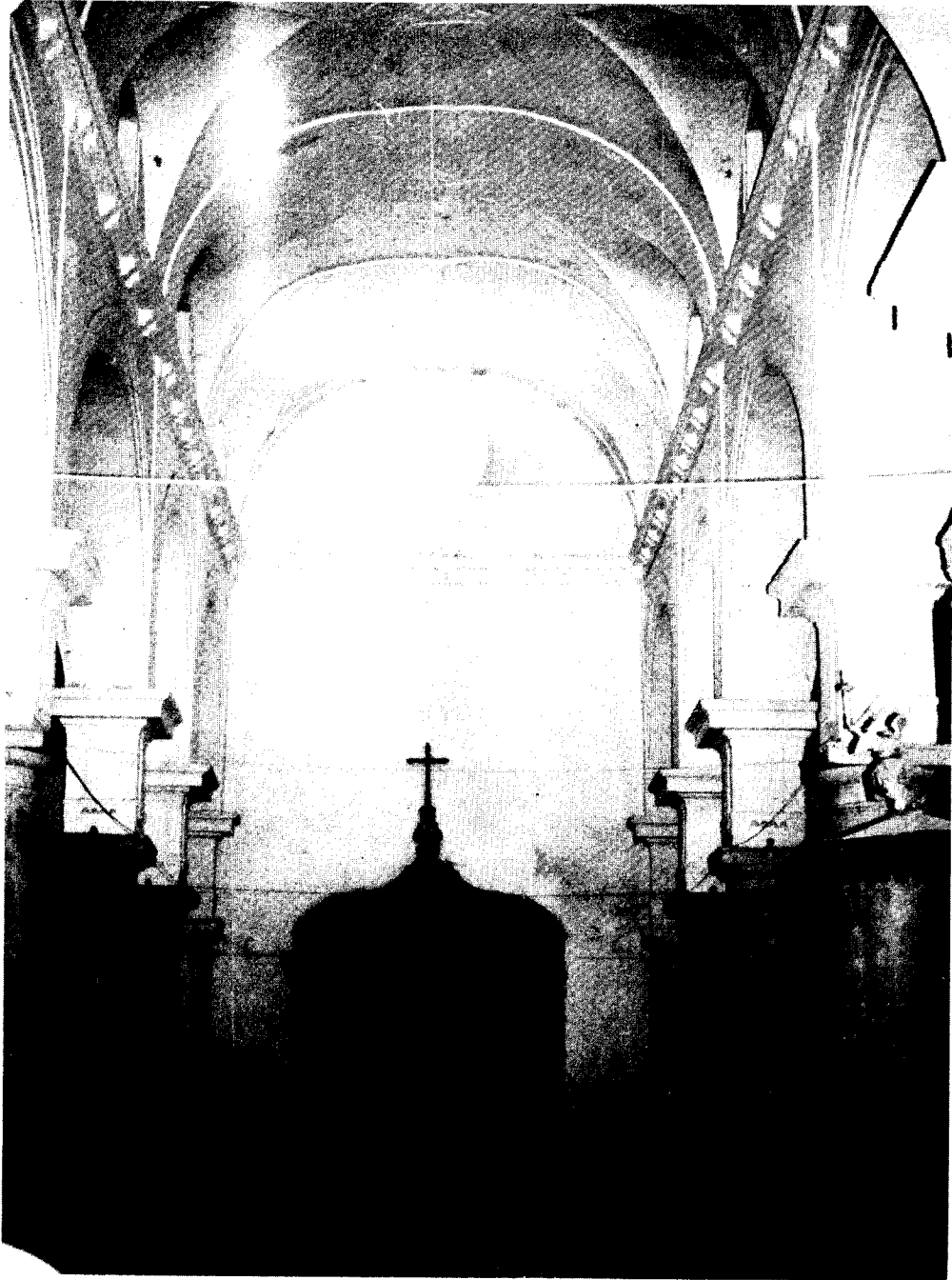
LAMINA I Cañete la Real. Parroquia de S. Sebastián