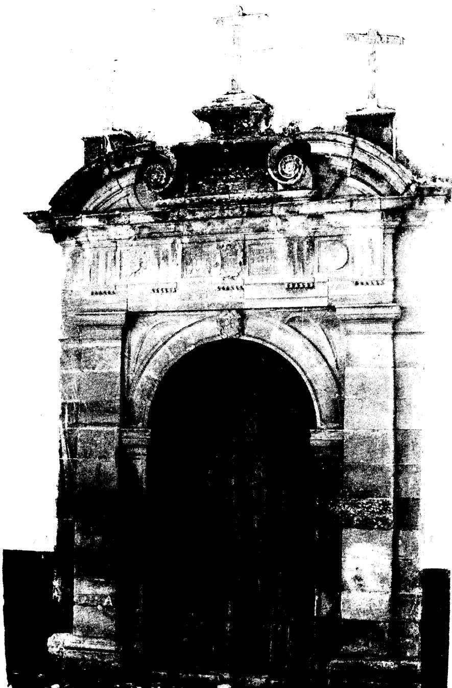
LAMINA III Cañete la Real. Parroquia de S. Sebastián. Portada lateral