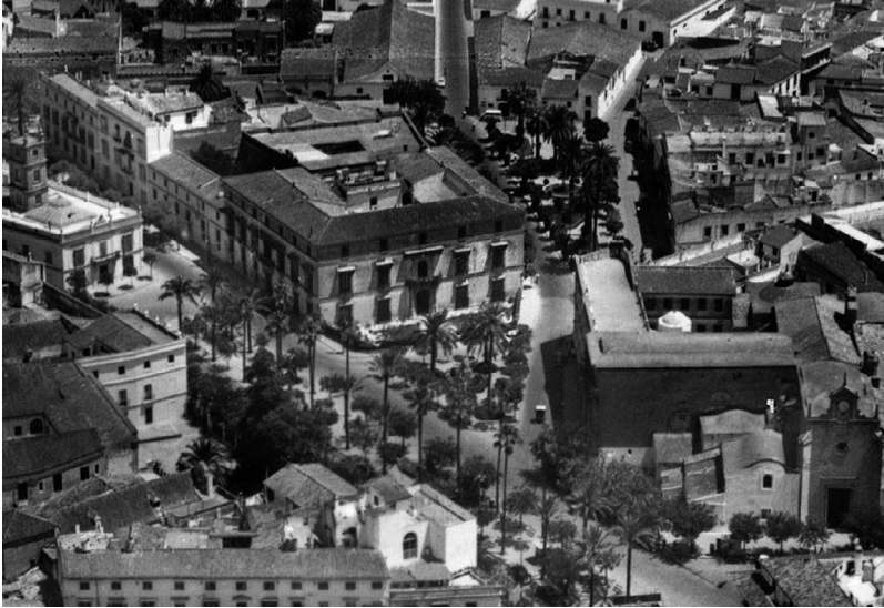
4. Vista aérea del palacio y su entorno a mediados del siglo XX (pueden verse las desaparecidas construcciones anexas a la trasera del edificio)

sobre las que también intervino Díaz y de las que sólo quedan los muros exteriores de sus cuerpos bajos 37 .