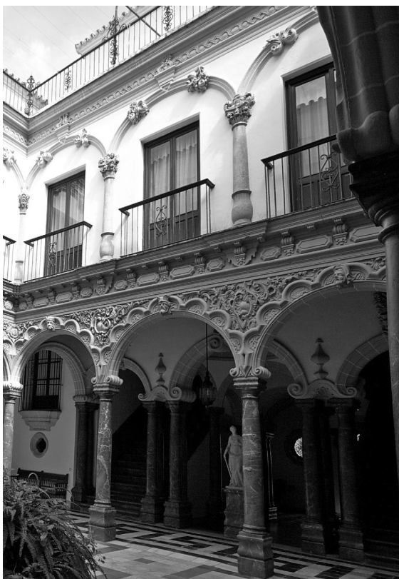
7. Vista del patio y la escalera principales del palacio