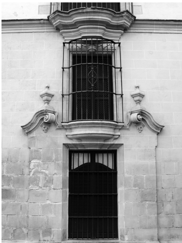
6. Portada de la fachada de la plaza Aladro

una moldura polilobulada, las enjutas están ocupadas por rocallas y en las claves están colocadas diferentes cabezas en relieve. Estas representan diversas testas humanas y monstruosas con un cierto interés por la caracterización. Al igual que ocurre con los relieves que se hallan en las dos esquinas de la fachada principal, es probable que sean más que un mero adorno sin significación y exista detrás un programa iconológico que por ahora se nos escapa. Baste comentar que en el arco central que se halla delante de la escalera se ha colocado un personaje masculino con sombrero alado, tal vez una representación de Mercurio, el dios romano del comercio, lo que a su vez podría aludir a la actividad mercantil del propietario de la casa. Ya en el cuerpo superior se abren a eje con los arcos inferiores balcones enmarcados por medias columnas sobre las que recaen medios puntos. Estas columnas adquieren una forma abalaustrada al poseer el tercio inferior del fuste abombado. Es un tipo de soporte que, aunque con diferente di-