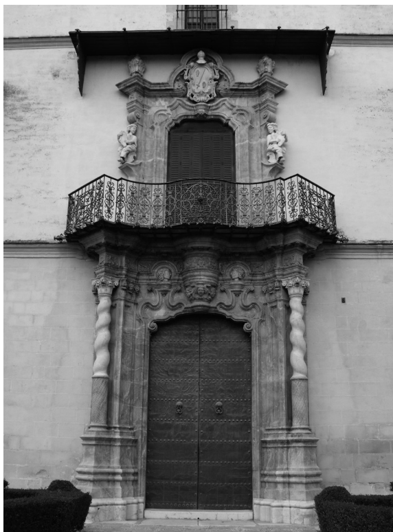
5. Portada principal del palacio

privado de la vivienda. Aquí se citan el dormitorio, el gabinete, el comedor o la sala y la cocina principales. El soberado, por último, se empleó para almacenes de granos, pajar y tendedero de ropa. La escritura aporta también algunos datos sobre materiales, hablándonos del empleo de solería de «lozas de Génova», «mármol de colores de Ytalia» para la escalera y las columnas del patio principal o «madera de segura y bovedillas» para los techos 38 .