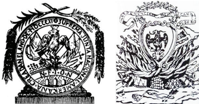
Primer sello oficial de la Suprema Junta (1811) y Gran Sello de la Nación (1815).

La Bandera Nacional aprobada por el Supremo Congreso el 3 de julio de 1815 unificaba el nuevo Gran Sello de la Nación con el azul celeste y blanco de la Inmaculada Concepción.