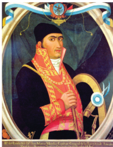
Retrato del Excelentísimo Señor Don José María Morelos. Capitán General de los Ejércitos de América. Vocal de su Suprema Junta y Conquistador del Rumbo del Sur. Anónimo indígena oaxaqueño, óleo/tela, 82 x 69 cm. Fuente: Museo Nacional de Historia Castillo de Chapultepec.

Desde el Palacio Nacional en Puruarán (Michoacán) el Soberano Congreso expidió el Decreto del 3 de julio de 1815 con el que se fijaba el Gran Sello de la Nación reformando el realizado en 1811 como Primer Escudo y Sello oficial de la Suprema Junta.