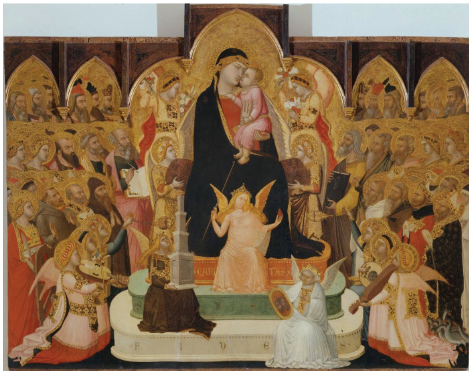
Maestá di Massa Marittima de Ambrogio Lorenzetti (1335), Museo de Arte Sacro de Massa Marittima.