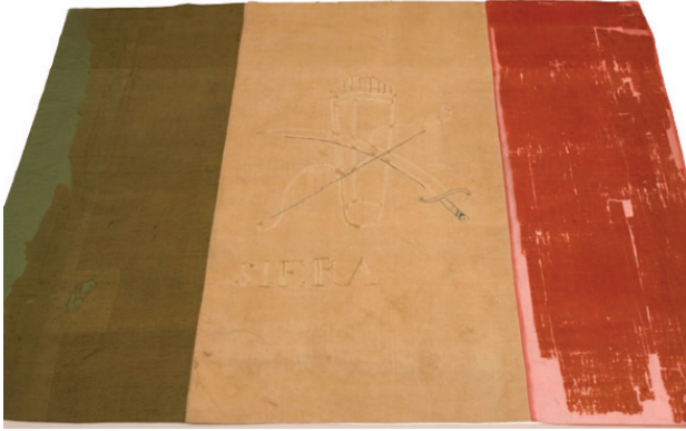
Bandera Siera (Sierra), paño de lana verde y tela de lino blanca y roja (1812-1817).