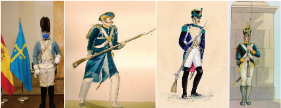
FIGURAS 15, 16, 17, 18

Soldado realista en la Conmemoración del 25 de mayo de 1808. ARHCA Asociación de Recreación Histórico Cultural de Asturias http://www.arhca.es/v1/arhca_inicio.htm . Fuente: "Asturias necesita hoy rebelión, confianza y audacia", proclama Barbón ante el nuevo giro industrial "que solo puede ser verde y digital". ARDURA, J.A., La Nueva España . Oviedo (25/05/2021) https://www.lne.es/asturias/2021/05/25/asturias-necesita-hoy-rebelion-confianza-52232766.html ; Soldado asturiano del Ejército Realista. Acuarela de Theubet de Beauchamp. Fuente: https://es.wikipedia.org/wiki/Archivo:Soldado_asturiano_del_Ej%C3%A9rcito_Realista_Acuarela_de_Theubet_de_Beauchamp.jpg . Soldado realista Real Regimiento Talavera de la Reina (1810-1814) Francisco Leiva Mella. Fuente: https://www.museoyerbabuenas.gob.cl/638/w3-article-51310.html?_noredirect=1 . Soldado trigarante, Historia Gráfica del Ejército Trigarante. Carlos D. Neve. http://miniaturasmilitaresalfonscanovas.blogspot.com/2015/01/historia-grafica-del-ejercito-mexicano.html